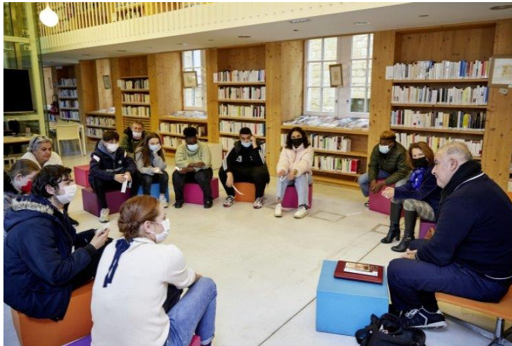
Magyd Cherfi, édition 2020 des Lectures vivantes