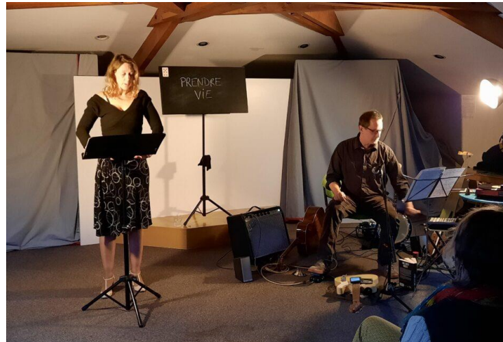
Cie Les pieds bleus, édition 2022 des Lectures vivantes