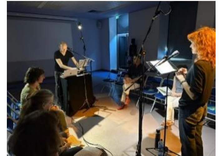
Théâtre d'Aymare, édition 2023 des Lectures vivantes