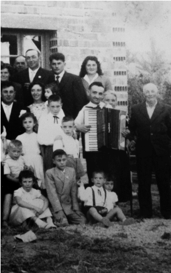
Accordéoniste lors d'un mariage d'Italiens dans le Gers

Durant la résidence, s'est dessiné au fur et à mesure un triptyque d'exposition : « Des histoires de terre – Storie della terra ».