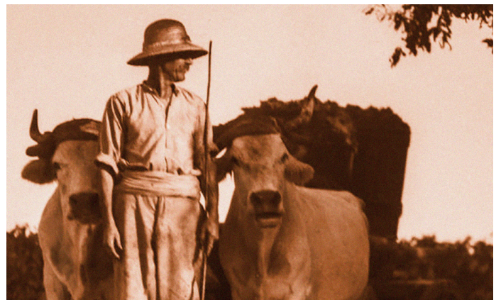
Reportage viticole d'armagnac, AD032 10Fi 1029, fonds Calbaban

À l'intérieur, à la manière d'un journal suivant chronologiquement l'histoire, une exposition retrace l'utilisation des documents et images d'archives dans le processus créatif de Lilie Pinot et Matthieu Rosier.