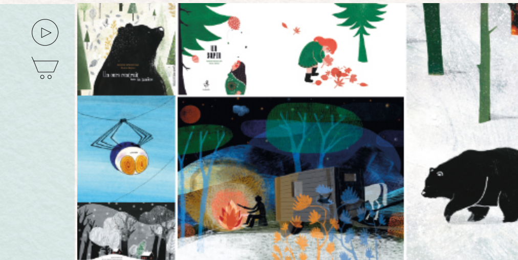
Illustrations: Bruna Barros, Antonio Boffa, Shin Hyuna © Lirabelle

DURÉE DU SPECTACLE : 25 minutes + avec les scolaires intervention de 30 min, à durée adaptable