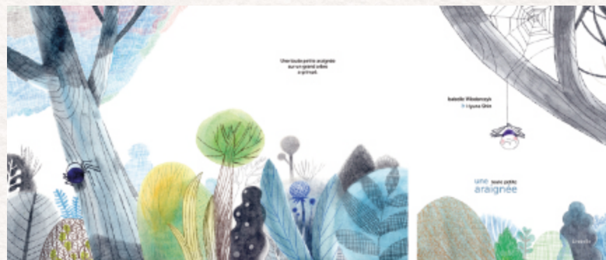
Illustrations: Shin Hyuna © Lirabelle

Ce spectacle parsemé de chansons s'adresse aux plus jeunes et regroupe les textes et les illustrations de plusieurs albums, écrits par Isabelle Włodarczyk , issus de comptines russes, tziganes, portoricaines, publiées aux Éditions Lirabelle . Les enfants parcourront les continents en poésie, accompagnés des notes de Pierre Diaz .