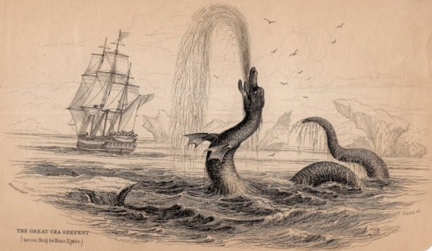
THE GREAT SEA SERPENT [according to Hans Egede.]