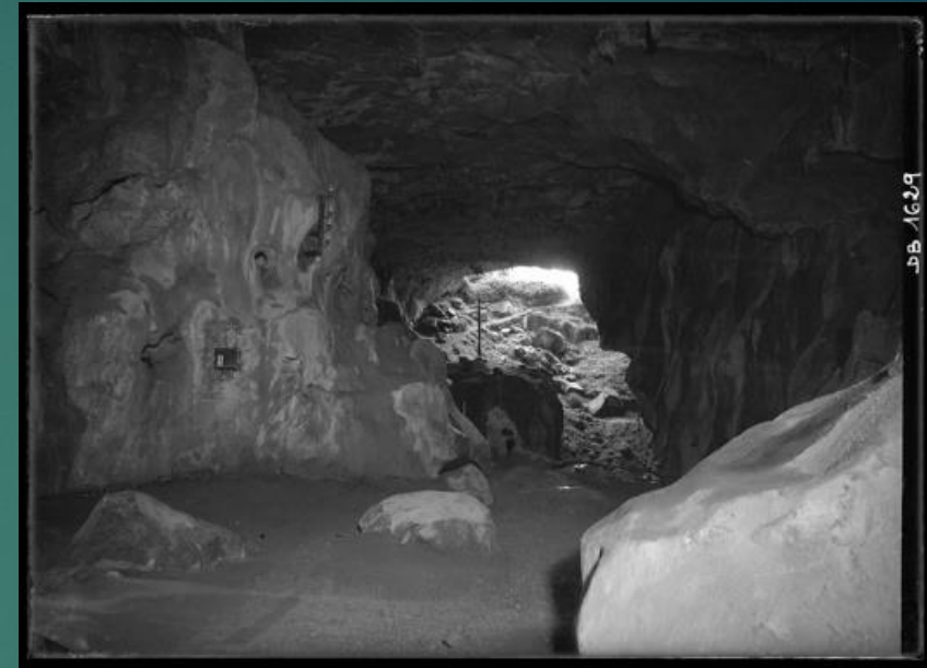
62 Fi 1741 – Grotte de Bédeilhac