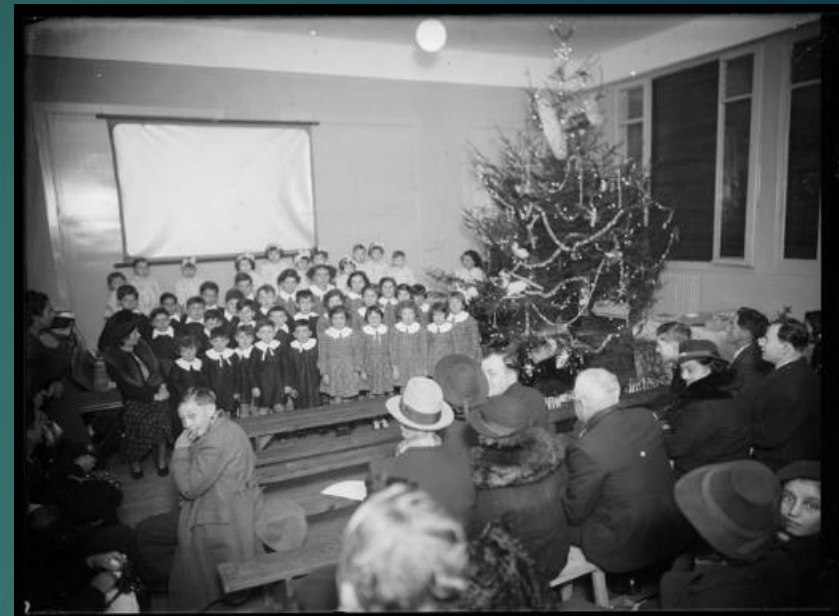
62 Fi 1432 et 1606