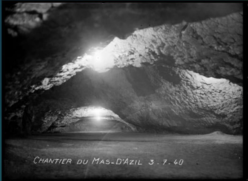
62 Fi 1931 – Grotte du Mas d'Azil