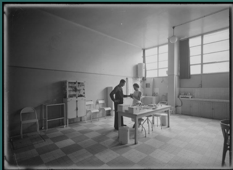
62 Fi 2408 – Infirmerie