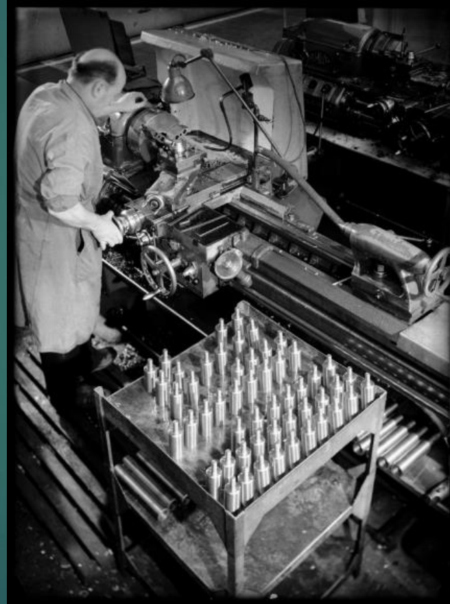
62 Fi 8765 – Ouvrier Tourneur