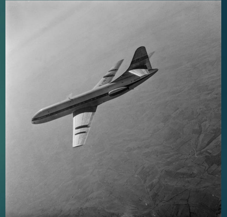
62 Fi 17418 – SE, 210 Caravelle