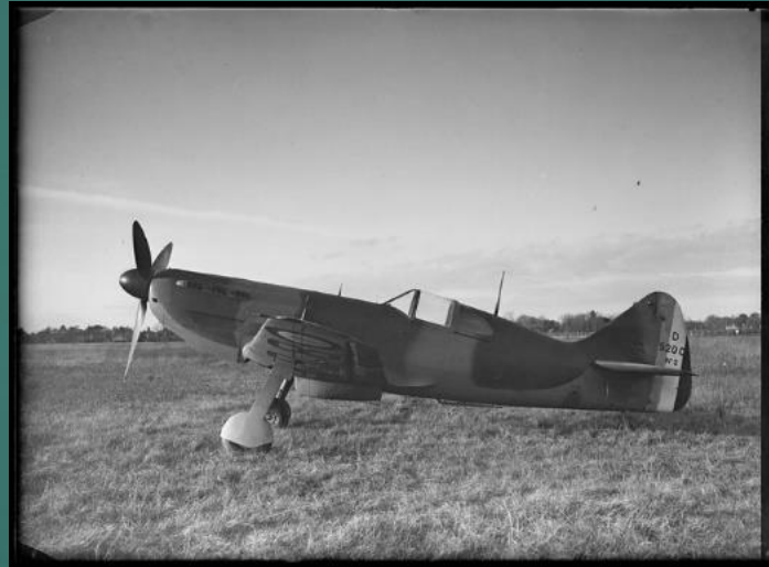
62 Fi 202 – D.520