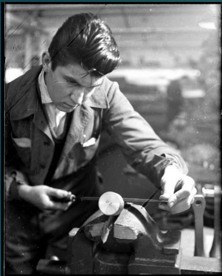
62 Fi 10135 – Ouvrier ajusteur en 1955