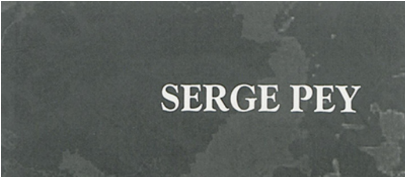
Table des négociations : poème-slogan pour une artiste-guerrière ilnu de Mashteuiatsh