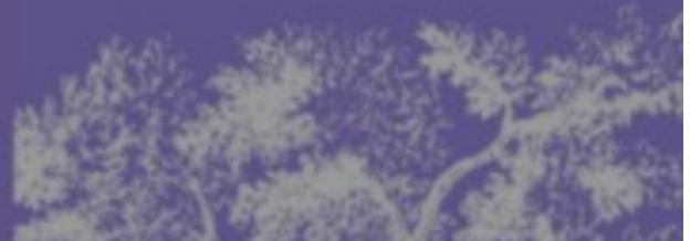
Table Ronde Intelligence