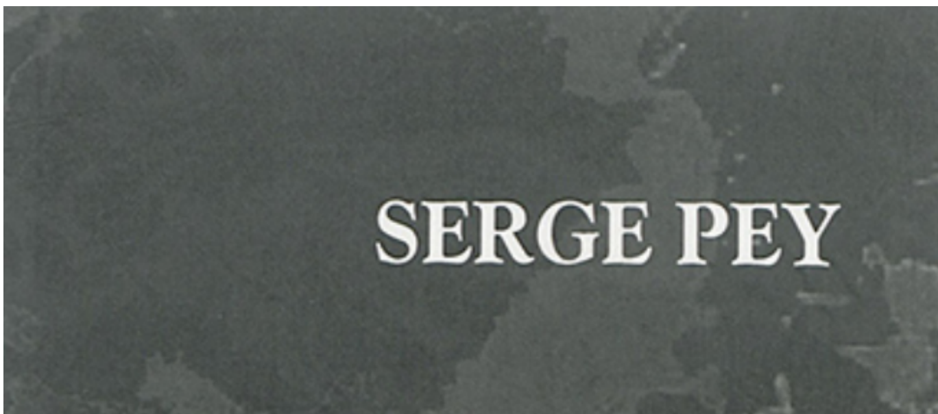
Table des négociations : poème-slogan pour une artiste-guerrière ilnu de Mashteuiatsh