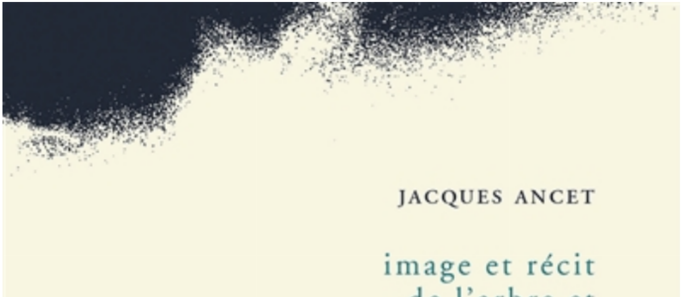
Image et récit de l'arbre et des saisons