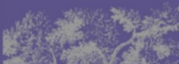
Table Ronde Intelligence

Cahiers du Cercle Nicolas Andry : philosophie, épistémologie, art, chirurgie. n° 14, Intelligence artificielle. Mémoires et souvenirs : les orthopédistes célèbres