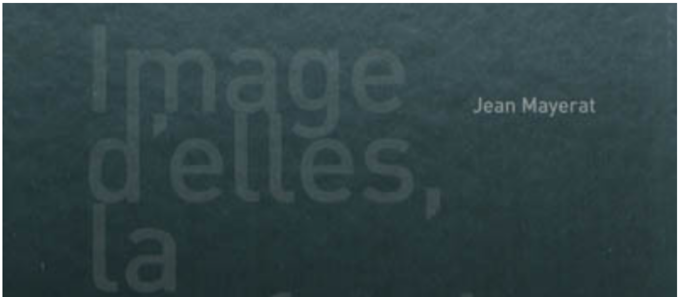
Image d'elles, la profondeur du noir