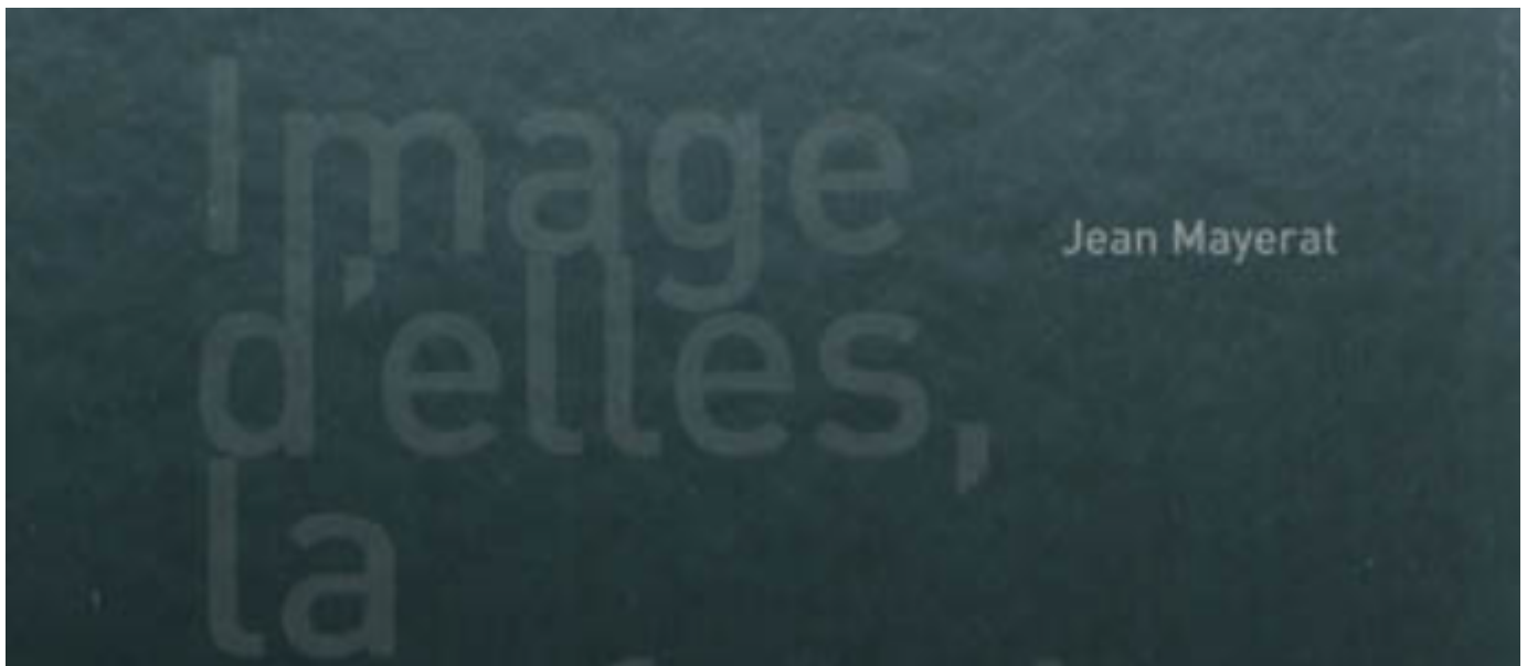
Image d'elles, la profondeur du noir